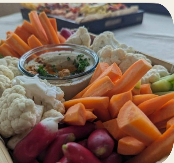
PLANCHE DE CHARCUTERIE & LEGUMES DE SAISON