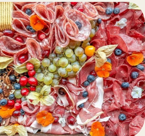
PLANCHE DE CHARCUTERIE ET FROMAGES 2,5KG